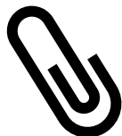
Tableau des prestations

La Prestation canadienne d'urgence (PCU) consiste en une allocation de 500 $ par semaine pendant un maximum de 24 semaines du 15 mars au 3 octobre 2020. Cette mesure a été prise afin de simplifier les mécanismes d'aide et d'accélérer le traitement des demandes et parce que le régime d'assurance-emploi n'a pas été conçu pour traiter le volume sans précédent de demandes reçues. Optez pour le dépôt direct afin d'obtenir votre prestation rapidement. Faites votre demande de PCU en ligne au https://www.canada.ca/fr/services/prestations/ae/pcusc-application.html ou par téléphone à l'aide d'un service téléphonique automatisé : 1-800-959-2041 ou 1-800-959-2019.